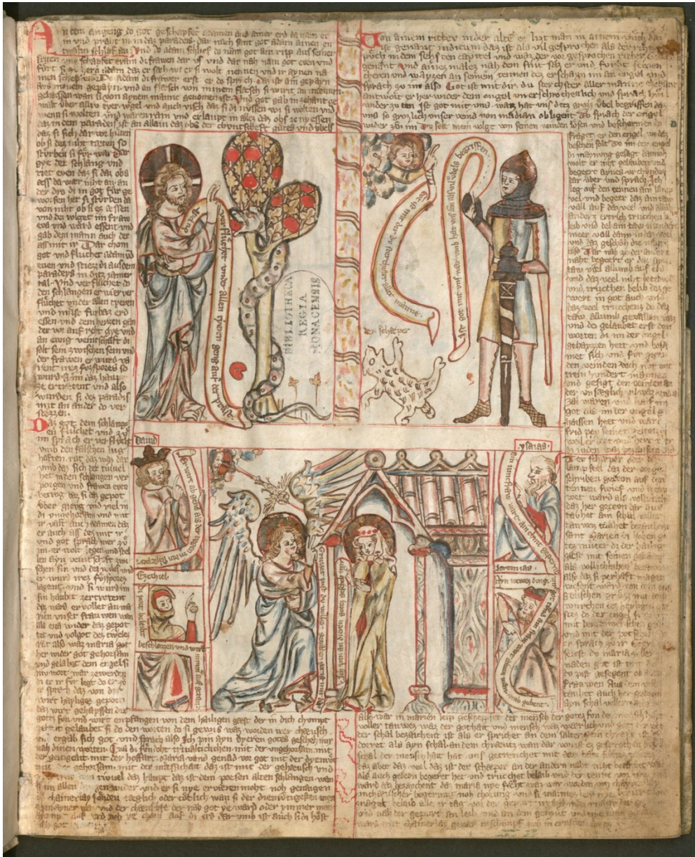
Abbildung 8: Armenbibel. Bayerische Staatsbibliothek München Cgm 20, fol. 1r. Lizenz: CC BY-NC-SA 4.0.