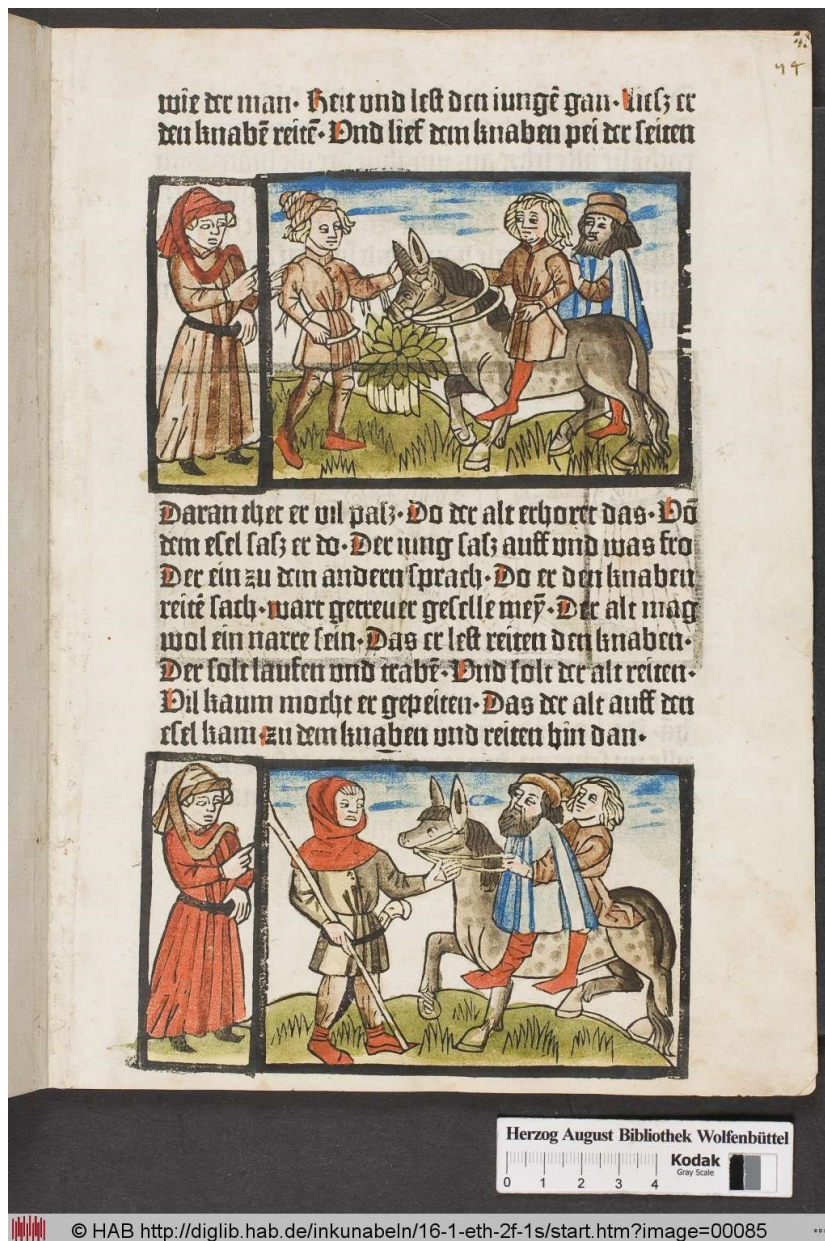
Abbildung 1: Ulrich Boner, Der Edelstein , Bamberg 1461: Albrecht Pfister (GW 4839). Wolfenbüttel, Herzog August Bibliothek 16.1 Eth. 2° (I), fol. 44r. Lizenz: CC BY-SA 3.0 DE. Quelle: http://digilib.hab.de/inkunabeln/16-1-eth-2f-1s/start.htm?image=00085 .

Sammlung aufgrund einer bestimmten Fabel, die aber im Bamberger Druck gar nicht auftaucht. Ein einziges Exemplar dieses Drucks ist heute in Wolfenbüttel zu finden.