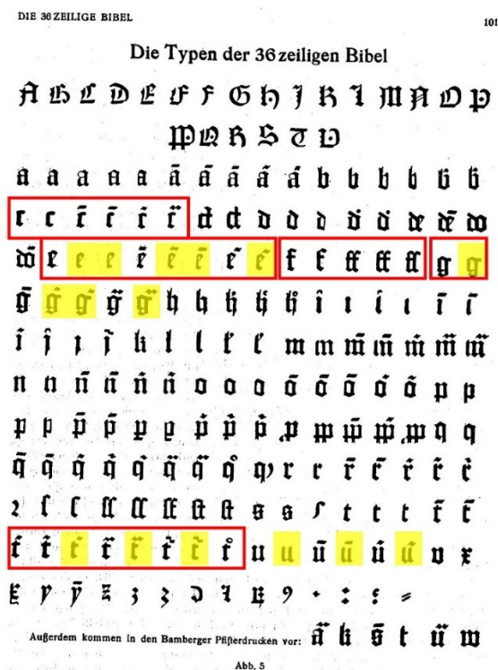
Abbildung 5: Typen der 36-zeiligen Bibel nach Zedler: Bamberger Pfisterdrucke (wie Anm. 5), S. 101. Gemeinfrei, bearbeitet von Falko Klaes. Quelle: Scan von Buch.

Als weiteres Beispiel können die Ackermanndrucke angeführt werden, um die es eine heftige Forschungskontroverse gab. Zedler erkannte in einer unikal überlieferten Ausgabe vom Ackermann den ersten Druck Pfisters überhaupt. Er begründete dies anhand druck- und satz-technischer Momente. So ist beim vermeintlich frühen Ackermann-Druck aus Wolfenbüttel der Zeilenschluss nur äußerst unzureichend, 18 während im Pariser Exemplar 19 der Rand deutlich besser eingehalten wird. Ferner sind im Wolfenbütteler Ackermann zahlreiche Verstöße gegen die Gutenbergschen Satzregeln festzustellen. 20