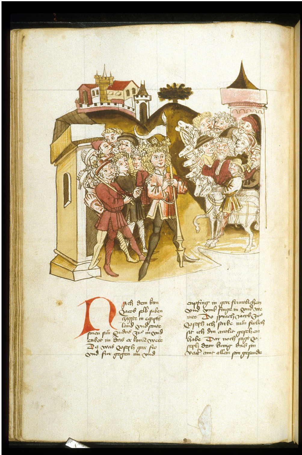
Abbildung 7: Joseph mit Jacob in Ägypten. London, The British Library, MS Egerton 856, fol. 44v. Gemeinfrei.