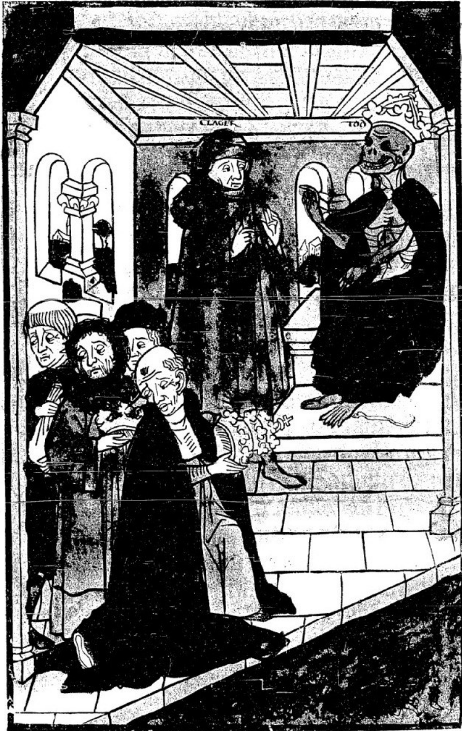
Abbildung 10: Johannes von Tepl, Der Ackermann aus Böhmen , Bamberg um 1463: Albrecht Pfister (GW 194). Paris, Bibliothèque Nationale, Res. A. 1646 (1). Gemeinfrei.