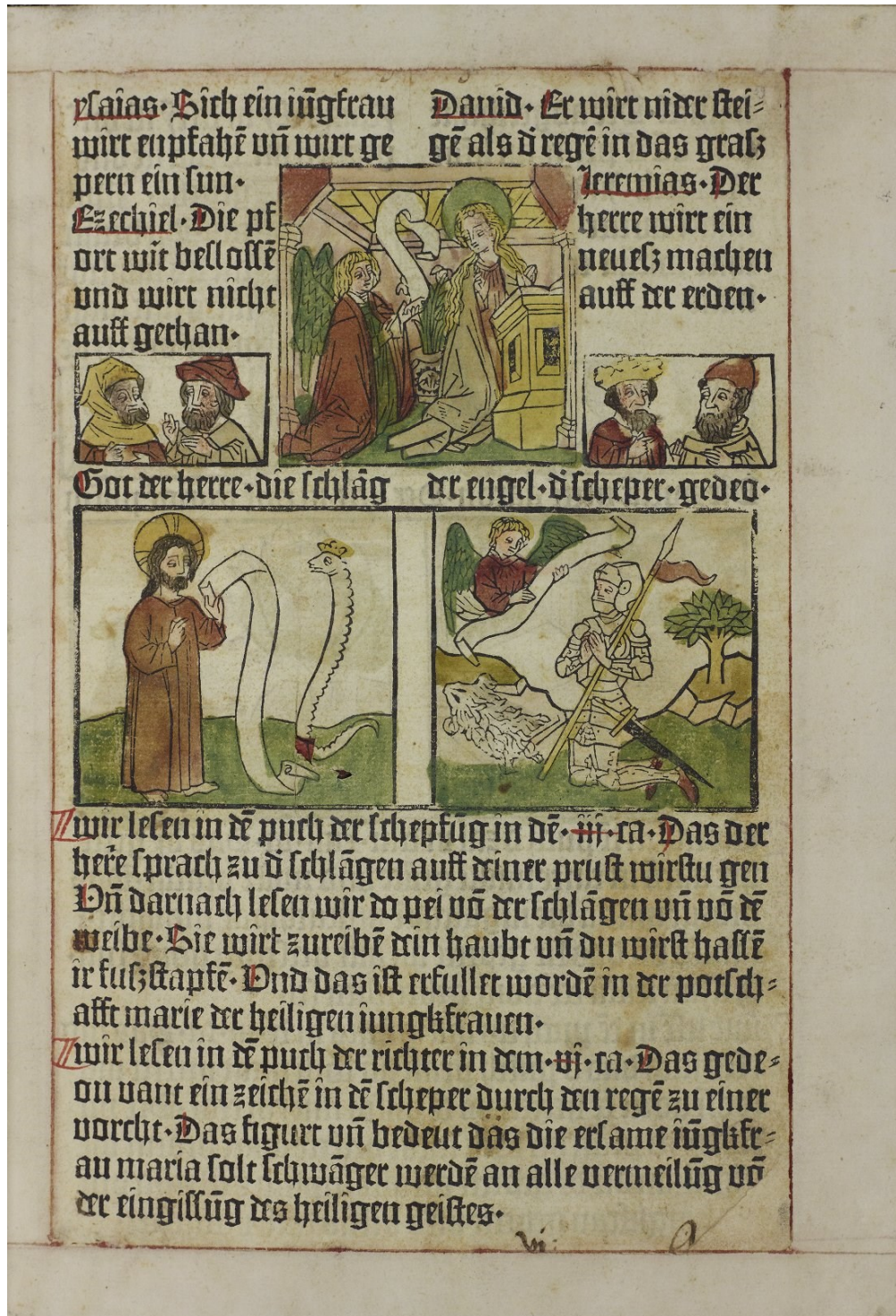
Abbildung 9: Biblia pauperum, deutsch. Bamberg [um 1463: Albrecht Pfister]. Manchester, The John Rylands Library, Inc. 9402, fol. 1r. Lizenz: CC BY-NC-SA 4.0. The Manchester University Library. Quelle: https://enri-queta.man.ac.uk/luna/servlet/s/7757i3 .