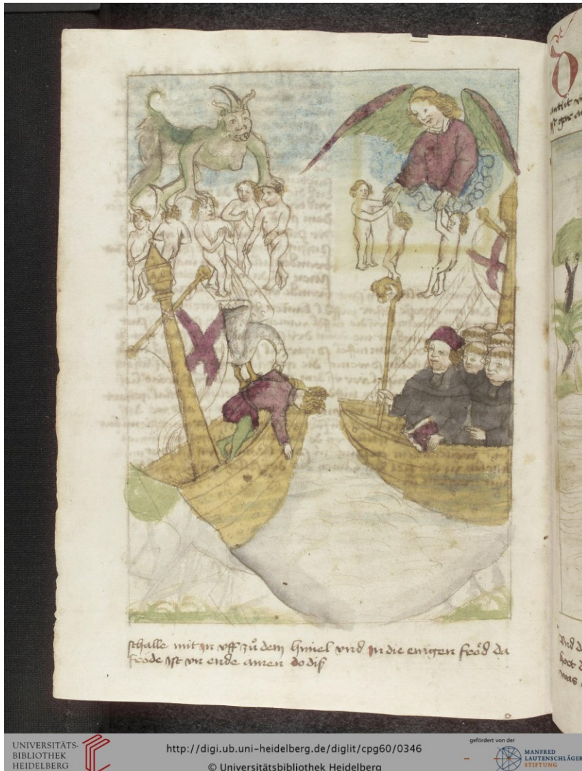
Abb. 1: Brandan und seine Mönche auf dem Klebermeer , Heidelberg, Universitätsbibliothek, Cpg 60, Bl. 167v, https://digi.ub.uni-heidelberg.de/diglit/cpg60/0346 . Lizenz: CC BY-SA 3.0.DE ( https://creativecommons.org/licenses/by-sa/3.0/de/ ).

Auch für die dem Deutschen Orden zuzurechnende Handschrift Mgo 56 (Mitte 14. Jahrhundert) kann ein manuskriptübergreifendes Konzept nachgewiesen werden. 5 Das Interesse des Ordens galt in der Textauswahl enzyklopädischen Informationen zum Orient, Wissen zum Dies- und Jenseits sowie zahlreichen Beschreibungen höfischer Pracht. Für diese Motivkomplexe bietet die Reise viele Anknüpfungspunkte. Die Attraktivität der ausgewählten Textformationen ist in