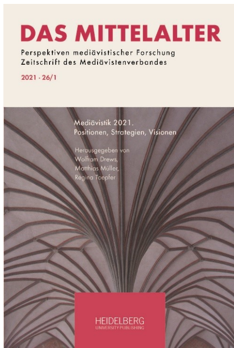
Abb. 2: Entwurf eines Covers des ersten digital publizierten Themenhefts der Zeitschrift ‚Das Mittelalter – Perspektiven mediävistischer Forschung‘, heiUP, Lizenz: CC BY-ND 4.0, https://creativecommons.org/licenses/by-nd/4.0/ .