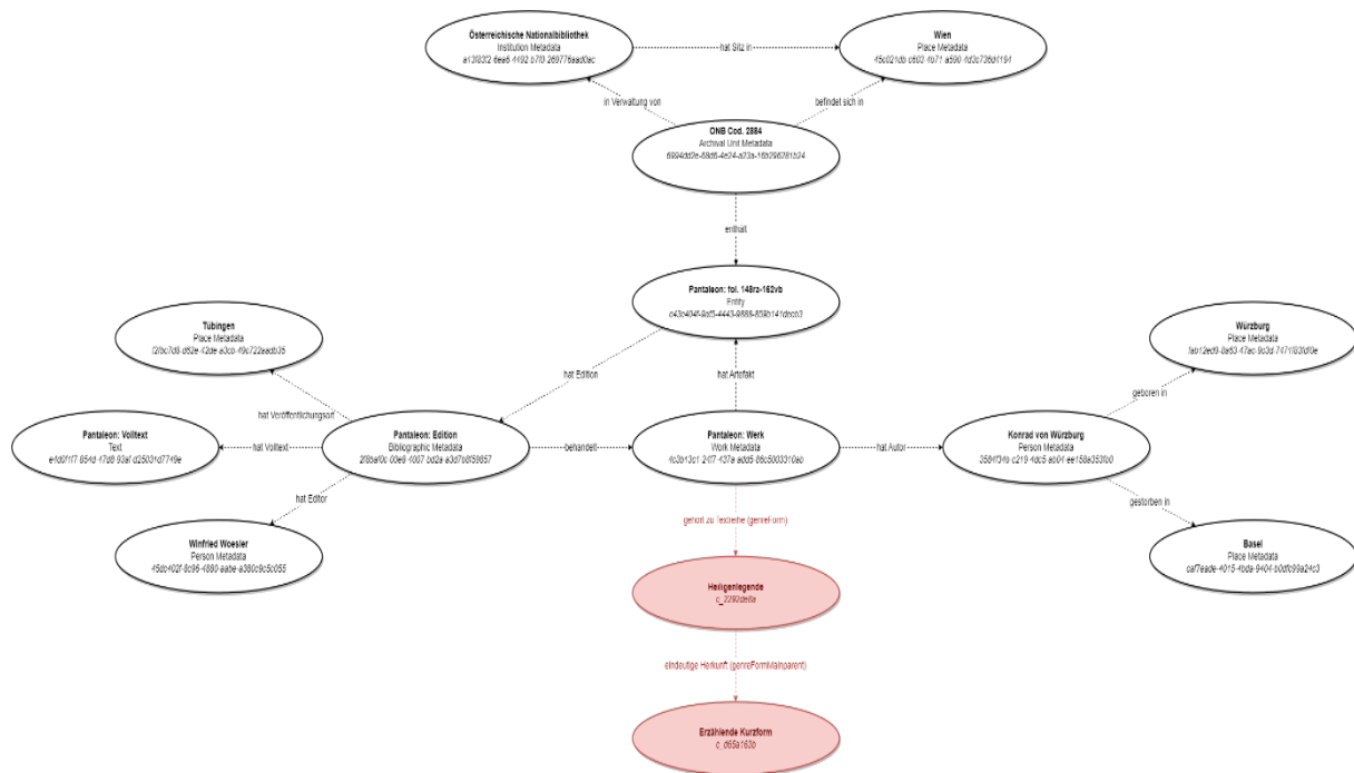
Abb. 3: Datenmodell der MHDBDB-Metadaten. Katharina-Zeppezauer Wachauer, Lizenz: CC BY 4.0, https://creativecommons.org/licenses/by/4.0/deed.de . (Abbildung in voller Auflösung: https://mittelalter.hypotheses.org/files/2023/06/BibliografischeMetadaten_Pantalon.drawio.png )

Zweitens ist das Vokabular auch in den bibliografischen Metadaten enthalten, und zwar bereits auf Werkebene (was in die Ebene der Editionen und MHDBDB-E-Texte mit übernommen wird):