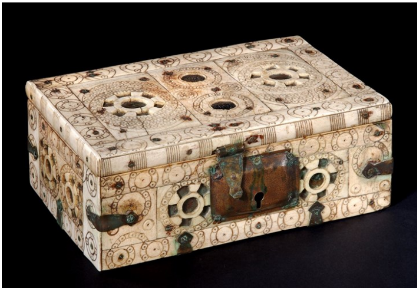
Abb. 1: Reliquienkästchen aus Wunstorf, um 1000, 18,2 x 12,5 x 7,2cm, Holzkern 1862 erneuert, Schoß neuzeitlich ergänzt, Museum August Kestner, Hannover, Inv. Nr. WM XXI,18, https://nds.museum-digital.de/object/85639 .

Aus dem Besitz von St. Cosmas und Damian in Wunstorf wurde 1862 ein Reliquienkästchen an das Welfenmuseum übergeben. Es stammt aus dem ursprünglich St. Petrus und Paulus geweihten Damenstift Wunstorf. Bischof Dietrich von Minden (r. 853–880) gründete das Stift um 865 und stattete es mit Erlaubnis des ostfränkischen Königs Ludwigs des Deutschen (r. 843–876) aus Eigengut und Besitz des Bistums Minden aus. Ein Privileg des Königs bestätigte 871 dem Stift Schutz, Immunität und die freie Wahl der Äbtissin. 1 Das Kästchen ist materiell unaufwändig gestaltet. Den Holzkern umkleiden ornamental mit Zirkelmotiven verzierte, teils durchbrochen gearbeitete Knochenplatten, denen vergoldete Kupferbleche unterlegt sind.