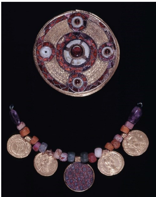
Abb. 7: Sarre Brooch/Scheibenfibel aus einem Frauengrab in Kent, 1. Hälfte 7. Jh., D. 6,8cm; Almandine, Muschelschale; zugehörige Kette mit fünf Anhängern: mittig ein Millefiori-Medaillon, daneben vier Goldmünzen: ein Solidus Chlotars II. (r. 584–629) sowie drei pseudo-byzantinische Münzen

Die kreuzförmige Gliederung dieser Doppelkreise erinnert jedoch auch an merowingische Scheibenfibeln wie die sogenannte Sarre Brooch, die in einem Frauengrab zusammen mit einer Kette mit anhängenden Goldmünzen gefunden wurde.