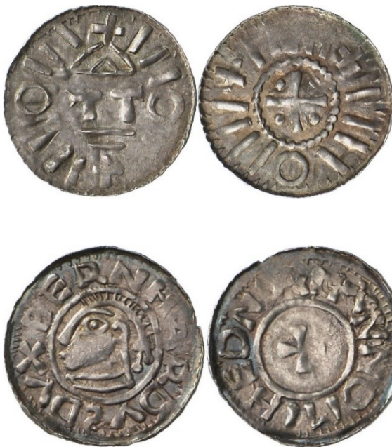
Abb. 3: Silberdenar Ottos I. (951–973), Prägeort: Magdeburg, 1,41g, D. 22mm, Münzkabinett der Staatlichen Museen, Berlin, Objektnr. 18202365, Aufnahme durch Lutz-Jürgen Lübke (Lübke und Wiedemann), https://ikmk.smb.museum/object?id=18202365 . Lizenz: keine (Public Domain).