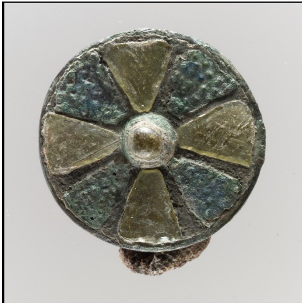
Abb. 8: Scheibenfibel, fränkisch 6. Jh., 3,5 x 2 cm, Kupferlegierung und Glasfluss, Metropolitan Museum, New York, Inv. Nr. 17.193.259, https://www.metmuseum.org/art/collection/search/465584 . Lizenz: CC0, https://creativecommons.org/publicdomain/zero/1.0/ .

Viele Scheibenfibeln spielen mit dem Wechsel von Goldglanz und farbigem Almandin bzw. Glaspaste. Dieses Spiel findet am Wunstorfer Beinkästchen eine Entsprechung in den vergoldeten Kupferplatten, die den durchbrochenen Kreisornamenten aus hellem Knochen unterlegt sind, heute auf Fotografien jedoch nur schwarz verschattet erscheinen. 13 Oft sind solche Scheibenfibeln kreuzförmig gegliedert, manchmal auch sechsteilig und rufen somit das Christusmonogramm XP auf. 14