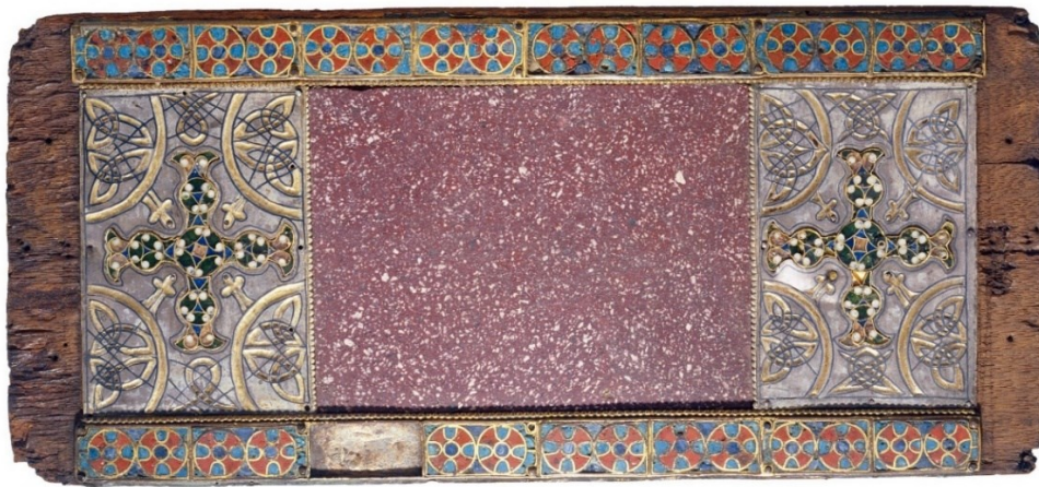
Abb. 6: Adelhauser Tragaltar, Franken/Regensburg? 3. Drittel 8. Jh., 2,1 x 38,1 x 17,3cm: Eichenholz mit eingelassenem Porphyrtstein zwischen Silberblechen mit Emailkreuzen und Niello-Zier, gerahmt durch Emailplättchen mit Kreisen mit eingeschriebenen Kreuzen, Augustinermuseum, Freiburg im Breisgau, Inv. Nr. A 1316, Foto: Hans-Peter Vieser, https://onlinesammlung.freiburg.de/de/object/07A7CDD8476CFA34BE1D02AA80915918 . Lizenz: CC BY 4.0, https://creativecommons.org/licenses/by/4.0/ .

Kreisäugen. Eine vergleichbare Rahmung durch Repetition einer Kreis-Kreuzform findet man z.B. in den Emails des Adelhauser Tragaltars.