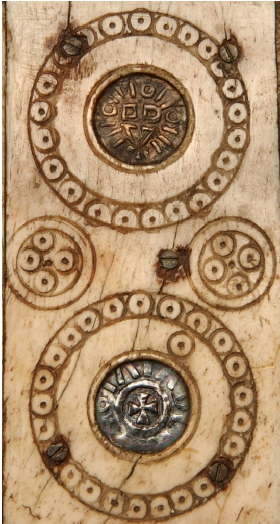
Abb. 2: Reliquienkästchen aus Wunstorf, Detail des Deckels mit Silberdenar Ottos I. (936–973) und einem Silberdenar mit Tatzenkreuz, Museum August Kestner, Hannover, Inv. Nr. WM XXI,18, https://nds.museum-digital.de/object/85639 . Lizenz: CC BY-NC-SA 4.0, https://creativecommons.org/licenses/by-nc-sa/4.0/ , Museum August Kestner, Christian Tepper und Christian Rose.