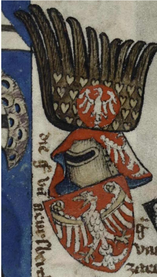
Abb. 14: Wappen der Grafen von Arnsberg, Wappenbuch Gelre, fol. 93v (Ausschnitt), InternetArchive, https://archive.org/details/gelre_armorial/page/n191/mode/2up?view=theater . Lizenz: keine (Public Domain).

Wenig überraschend ist die Übereinstimmung des Wappenschildes: in Rot ein silberner Adler. Auch das Oberwappen ist in beiden Darstellungen sehr ähnlich. In beiden Fällen sitzt auf dem Topfhelm ohne Helmwulst oder Krone ein schwarzer Adlerflug, der mit goldenen Herzen bestreut ist. Im Wappenbuch liegt auf dem Flug ein rotes Medaillon, in dem der silberne Adler steht. Im Falle der Holzdecke ist an dieser Stelle eine leichte Variation festzustellen. Hier liegt auf einem goldenen Medaillon ein roter Schild mit dem silbernen Adler. 46