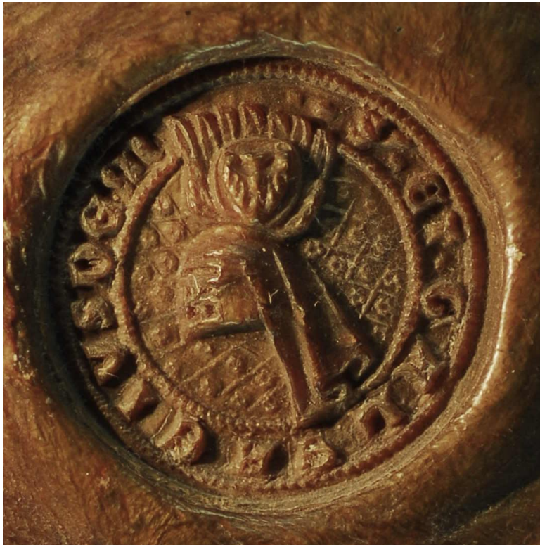
Abb. 19: Rücksigel Gottfrieds IV. von Arnsberg an einer Urkunde von 1348, Foto und Bildrechte: Landesarchiv NRW Abteilung Westfalen, A 118u/Kloster Oelinghausen/Urkunden, Nr. 358.

Noch deutlicher werden die Ähnlichkeiten mit der Fassung auf der Holzdecke in Haus Glesch, wenn man das Sekretsiegel des Grafen heranzieht: