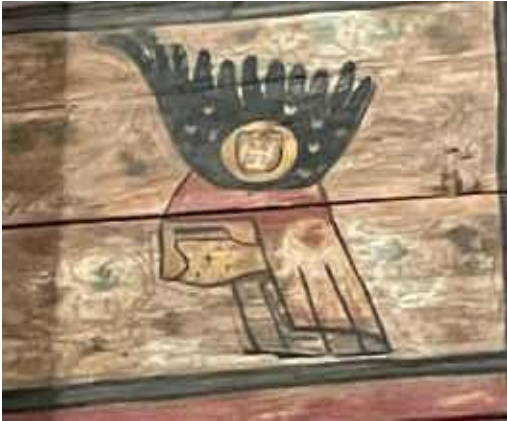
Abb. 15: Detailaufnahmen der Balkendecke aus Haus Glesch, Foto: Henrike Kant, Rostock.

Damit unterscheidet sich die Fassung im Haus Glesch auch von der nach dem Tod des letzten Arnsberger Grafen Gottfried IV. (1295–1371) errichteten Tumba im Dom, die die gleiche Helmzier zeigt wie das Wappenbuch Gelre, Flug mit Herzen, Adler im Medaillon ohne Wappenschild: