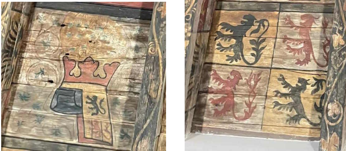
Abb. 8 und 9: Detailaufnahmen der Balkendecke aus Haus Glesch, Fotos: Henrike Kant, Rostock.

Die Darstellung auf der Holzdecke unterscheidet sich trotz oberflächlicher Ähnlichkeit nun in einigen signifikanten Punkten: