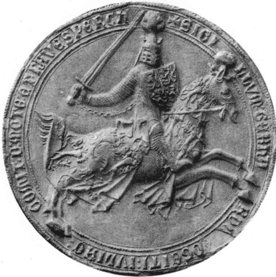
Abb. 13: Reitersiegel Gerhards von Jülich als Graf von Berg, Legende: +SIGILLVM GERHARDI [prim]OGE(n)ITI: IVLIAC(ensis): COMIT(is): D(e) MO(n)TE ET RAVE(n)SPERCH, in: Ewald, Rheinische Siegel (wie Anm. 37), Tafel 10, Nr. 11

Pferd und Reiter tragen hier Krone und Pfauenfeder-Busch, wie sie auch auf der Holzdecke aus dem Haus Glesch erscheinen. Auch dieses Detail ist bemerkenswert, da die bergischen Grafen zuvor ein mit Pfauenfedern bestecktes und mit dem bergischen Löwen belegtes Schirmbrett führten. 40 Eine analoge Helmzier verwendeten im Übrigen zeitgleich auch die Grafen bzw. Markgrafen von Jülich, die Grafen von Kleve und von der Mark. 41 Vermuten kann man daher, dass die Helmzier zunächst noch keine große Rolle spielte und vielmehr modischen Entwicklungen unterlag. Das änderte sich wie oben bereits erwähnt in der ersten Hälfte des 14. Jahrhunderts. Nach seiner Erhebung zum Markgrafen 1336 übernahm Gerhards Vater Wilhelm V. von Jülich eine neue Helmzier, den aus einer Krone wachsenden Pfauenfeder-Busch, wie er