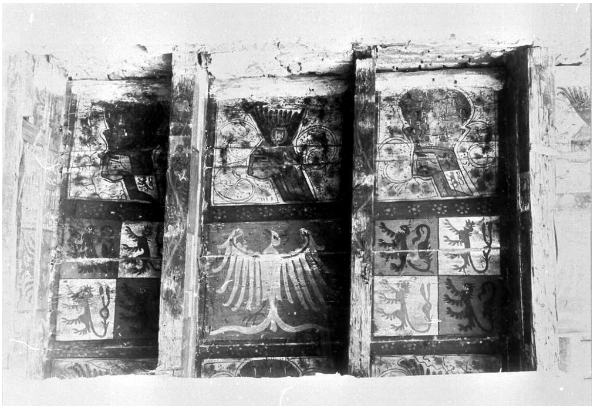
Abb. 4: Die Balkendecke aus Haus Glesch im Fundzustand, Foto von 1896 und Bildrechte: Historisches Archiv der Stadt Köln mit Rheinischem Bildarchiv, RBA 117494.

Als das Haus „Zur Mühlen“ bzw. Glesch 1896 abgetragen wurde, fand man in einem Raum im ersten Stock, der möglicherweise als Saal diente, 25 eine mit Wappendarstellungen bemalte Holzdecke. 26