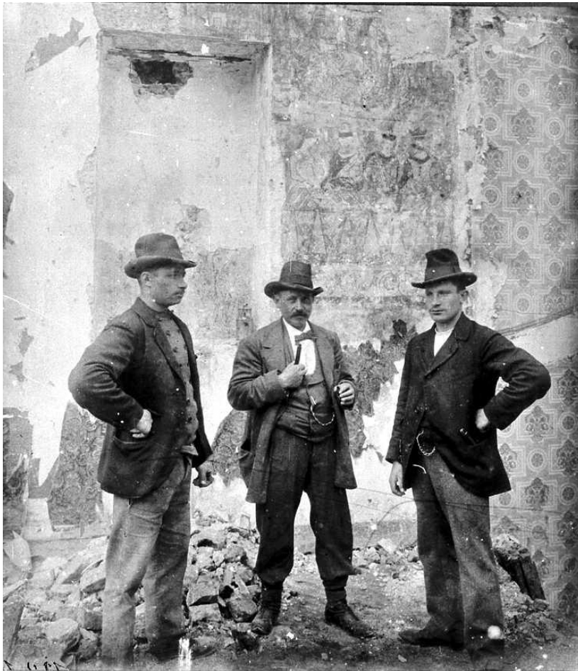
Abb. 2: Abbrucharbeiten im Haus Bingen, im Hintergrund das Wandgemälde, Foto von 1899 und Bildrechte: Historisches Archiv der Stadt Köln mit Rheinischem Bildarchiv, RBA 43131.

mittelalterliche profane Privatarhitektur ist dem Umbau zur modernen Großstadt lange vor dem Zweiten Weltkrieg zum Opfer gefallen.