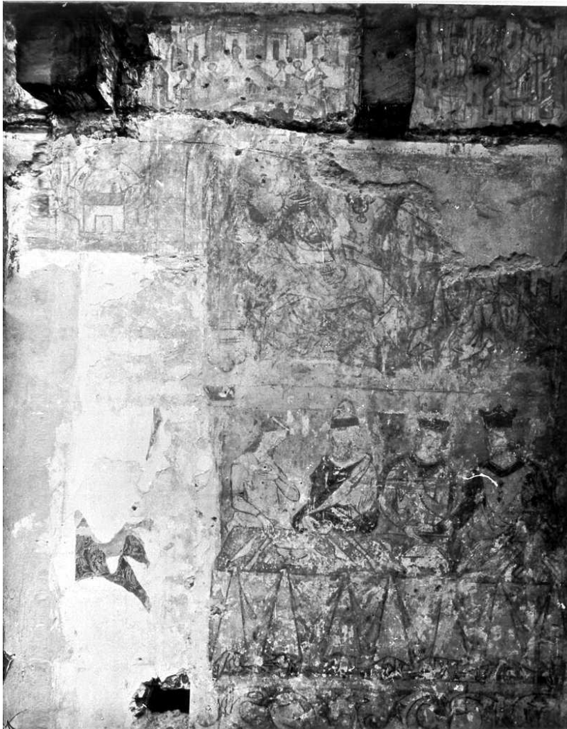
Abb. 1: Wandmalereien aus dem Haus Bingen, Holzmarkt 67, 1899 abgebrochen, Foto und Bildrechte: Historisches Archiv der Stadt Köln mit Rheinischem Bildarchiv, RBA 43142.

in die Zeit um 1300 datieren. 12 Im Haus Bingen sind im selben Raum romanische Wandmalereien gefunden worden, die ein Gastmahl darstellen. 13