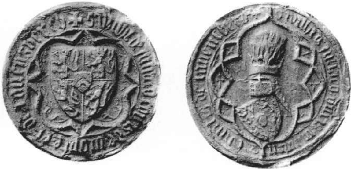
Abb. 10 und 11: Siegel Wilhelms II. von Berg (1361–1408), in: Ewald, Rheinische Siegel (wie Anm. 37), Tafel 11, Nr. 3 und 4, Fotos und Bildrechte: Hanstein-Verlagsgesellschaft mbH.

Die Fassung im Wappenbuch Gelre entspricht vollständig den Wappensiegeln Graf bzw. seit 1380 Herzog Wilhelms II. von Berg: 37