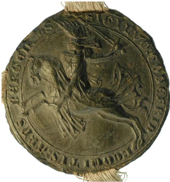
Abb. 17: Reitersiegel Gottfrieds IV. von Arnsberg an einer Urkunde von 1348, Foto und Bildrechte: Landesarchiv NRW Abteilung Westfalen, A 118u/Kloster Oelinghausen/Urkunden, Nr. 364.

Interessanterweise unterscheidet sich diese Form der Helmzier, wie sie bei Gelre und auf der Tumba dargestellt ist, von den belegten Siegeln des Grafen von Arnsberg. Auch auf Gottfrieds Reitersiegel ist der Flug mit einem Wappenschild in einem runden Medaillon belegt. 47