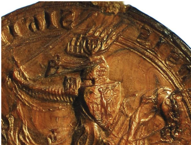
Abb. 18: Reitersiegel Gottfrieds IV. von Arnsberg, Ausschnitt, Foto und Bildrechte: Landesarchiv NRW Abteilung Westfalen, A 118u/Kloster Oelinghausen/Urkunden, Nr. 325.