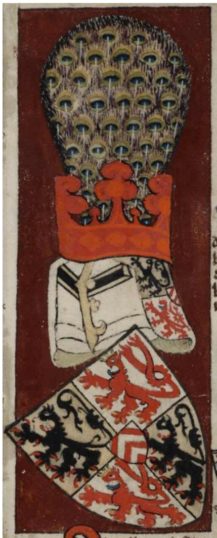
Abb. 7: Wappen Jülich-Berg-Ravensberg, Wappenbuch Gelre, fol. 92r (Ausschnitt)

Das Wappen der Grafen von Berg auf der Wappendecke ähnelt der entsprechenden Fassung im Wappenbuch Gelre. Da es im Folgenden auf die Unterschiede zwischen Wappenbuch und Wappendecke ankommt, beschreibe ich zunächst die Fassung des Wappenbuchs: Im gevierten Schild zweimal ein schwarzer Löwe in Gold (Feld 1 und 4, Grafschaft Jülich) sowie ein roter doppelschwänziger Löwe mit goldener Krone in Silber (Feld 2 und 3, Grafschaft Berg). 35 Als Herzschild drei rote Sparren in Silber (Grafschaft Ravensberg). Auf dem Schild der Topfhelm mit kurzen Helmdecken, auf denen das Wappen wiederholt wird. Auf dem Helm sitzt eine rote Laubkrone, aus der ein Busch von Pfauenfedern wächst.