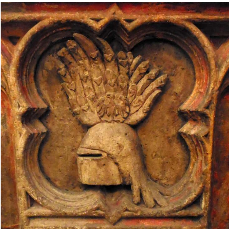
Abb. 16: Helm und Helmzier vom Hochgrab Gottfrieds IV. von Arnsberg im Kölner Dom, Foto: Marc von der Höh, Rostock.

Damit unterscheidet sich die Fassung im Haus Glesch auch von der nach dem Tod des letzten Arnsberger Grafen Gottfried IV. (1295–1371) errichteten Tumba im Dom, die die gleiche Helmzier zeigt wie das Wappenbuch Gelre, Flug mit Herzen, Adler im Medaillon ohne Wappenschild: