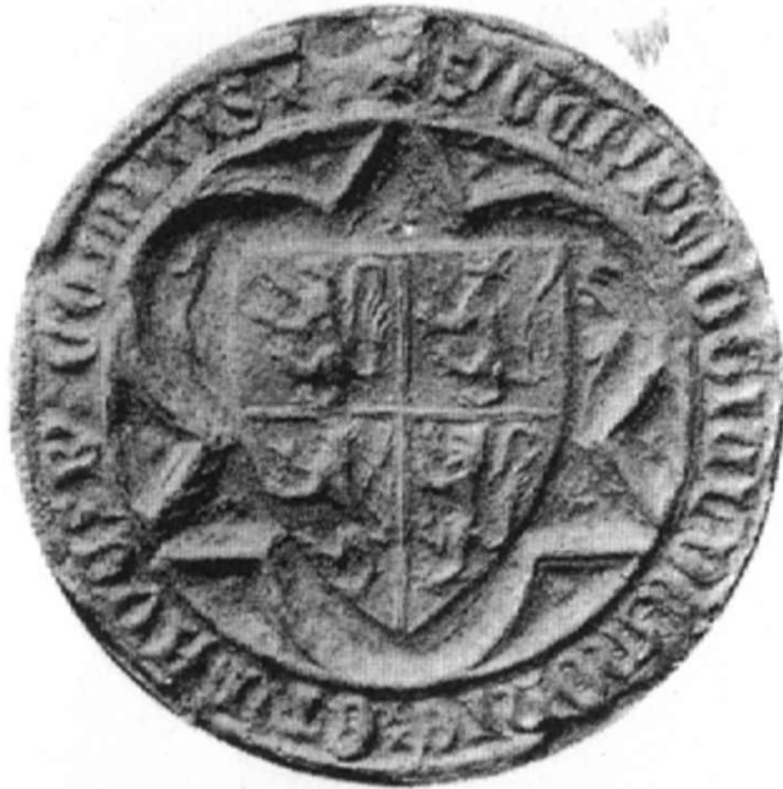
Abb. 12: Siegel Gerhards von Jülich als Graf von Berg (1348–1360), in: Ewald, Rheinische Siegel (wie Anm. 37), Tafel 10, Nr. 9, Foto und Bildrechte: Hanstein-Verlagsgesellschaft mbH.

Ich lasse offen, ob die bergischen Löwen hier ebenfalls keine Kronen tragen, oder ob dieser Eindruck auf den schlechten Erhaltungszustand des Siegels zurückzuführen ist. 38 Eindeutig ist, dass auf Gerhards Siegel das Wappen von Ravensberg fehlt. 39 Auf einem Reitersiegel des Grafen ist auch die hier erstmals zusammen mit dem bergischen Wappen nachweisbare Helmzier zu erkennen: