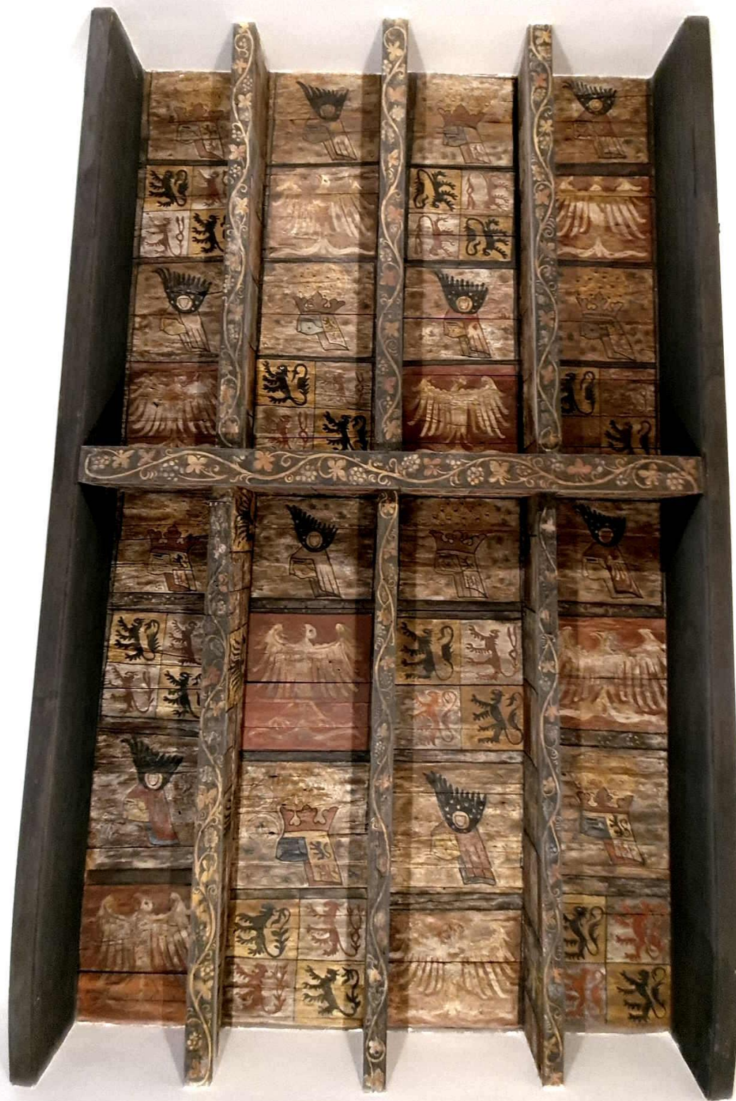
Abb. 5: Balkendecke aus dem Haus Glesch (Gesamtansicht), aktueller Zustand, Foto: Sarah Wenger, Rostock.