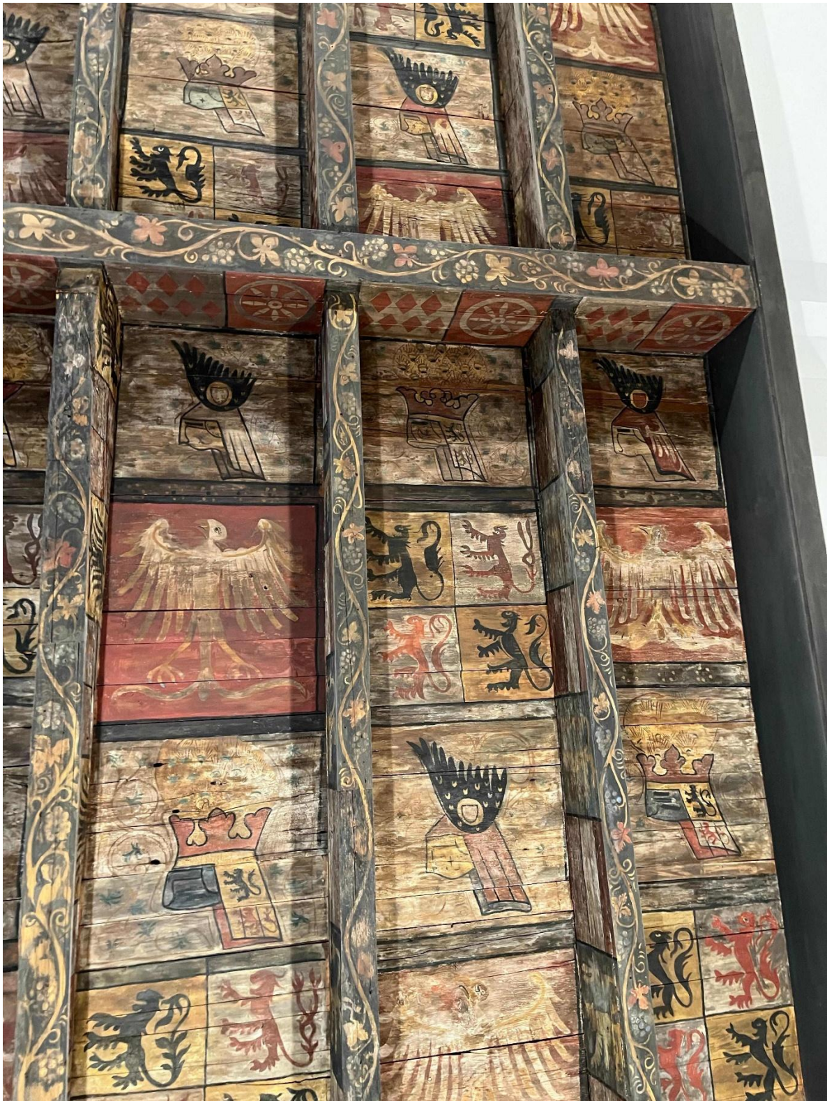
Abb. 6: Balkendecke aus dem Haus Glesch (Ausschnitt), aktueller Zustand, Foto: Henrike Kant, Rostock.