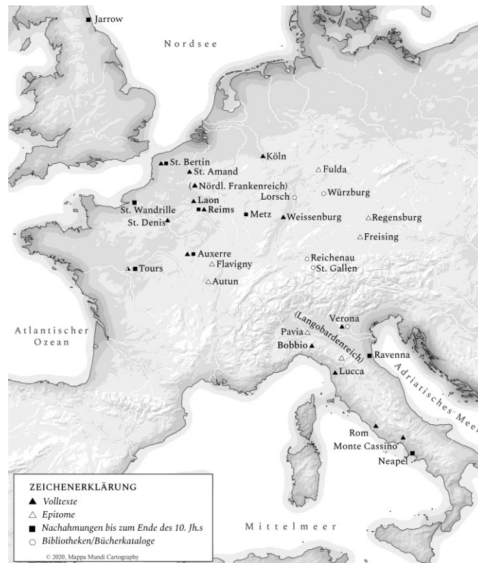
Abb. 4: Geographische Verteilung der frühesten überlieferten Textzeugen des Liber pontificalis aus McKitterick, Die frühmittelalterliche Verbreitung des Liber pontificalis (wie Anm. 56), S. 235. © 2002, Mappa Mundi Cartography.

Die Briefsammlungen entstanden dort vor allem aus Interesse an juristischen Verfahren und bevorstehenden synodalen Versammlungen. Zuweilen verweist die Überlieferung auch auf die Boten, welche die Schreiben in Gebiete nördlich der Alpen brachten. 57 Schwer zu beantworten bleibt aber die Frage, warum das Material nicht nach Abschluss der juristischen Verfahren vernichtet wurde. Jedenfalls dürften die Sammlungen an manchen Orten aufbewahrt worden sein, vielleicht um sie für künftige Rechtsfragen zu nutzen? Welchen Einfluss hatten die einige Generationen später lebenden Historiographen, die zu Ehren ihrer Kirche das Material nutzten? Jedenfalls dürfte Flodoard von Reims im 10. Jahrhundert das gesammelte Material gerne verwendet haben. Seine Reimser Kirchengeschichte wird damit zu einer Fundgrube für die Kon-